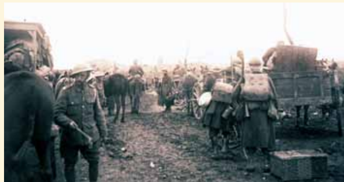
Militaires britanniques et belges durant l'offensive alliée finale.

Bien que l'armée belge demeura pour une large part en dehors des opérations sanglantes sur le front d'Ypres, il y eut quand même, outre un grand nombre de civils tués, 41.000 militaires belges qui périrent au cours de la Première Guerre mondiale. Les ravages de 1914 dans quelques villes et villages et surtout la destruction totale d'une grande partie du Westhoek firent que le prix payé par la Belgique dans cette guerre fut particulièrement élevé. Le pays avait également gravement souffert de l'occupation, car une bonne partie de l'industrie avait été démantelée et des milliers de civils avaient été déportés au profit du travail obligatoire. Sur le front même, l'armée belge avait subi une transformation remarquable : de l'armée encore très « dix-neuvième » du début de la guerre, elle était devenue, en 1918, une force opérationnelle active. Les bases des forces belges modernes avaient ainsi été jetées.