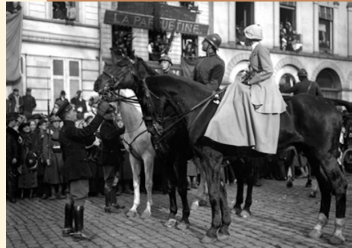
La Joyeuse Entrée à Bruxelles en 1918.

La présente brochure se limite aux initiatives de la Défense pour la première année de commémoration qui est placée entièrement sous le signe du rôle de l'armée belge dans la Première Guerre mondiale.