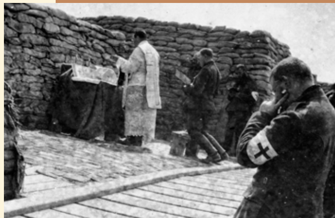
Célébration eucharistique dans les tranchées.

Informations complémentaires : www.be14-18.be/defense