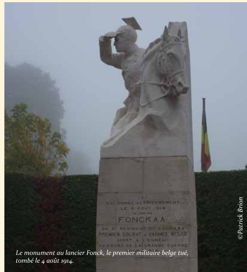
Le monument au lancier Fonck, le premier militaire belge tué, tombé le 4 août 1914.

Couverture : Le réduit du fort de Steendorp (près de Tamise), détruit par l'armée belge afin qu'il ne tombe pas aux mains des Allemands. Quatrième de couverture : Un soldat belge montant la garde sur la plaine de l'Yser.