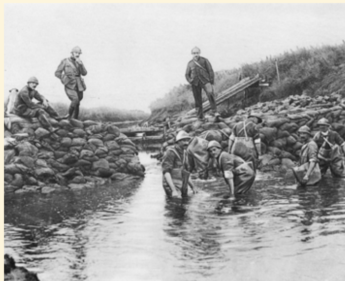
Réparations effectuées aux digues de l'Yser.

Lorsqu'au printemps 1918, les Allemands lancèrent leur offensive du Printemps et se mirent à gagner du terrain partout sur le front, il n'y eut qu'à Merkem dans le secteur belge qu'ils ne parvinrent pas à avancer. Il s'ensuivit un nouvel élan. À l'été 1918, la fortune des armes tourna définitivement à l'avantage des alliés. Le roi Albert I prit le commandement du « Groupe d'armées des Flandres » constitué de l'armée belge, de la II e armée britannique (de même importance), ainsi que de deux corps français.