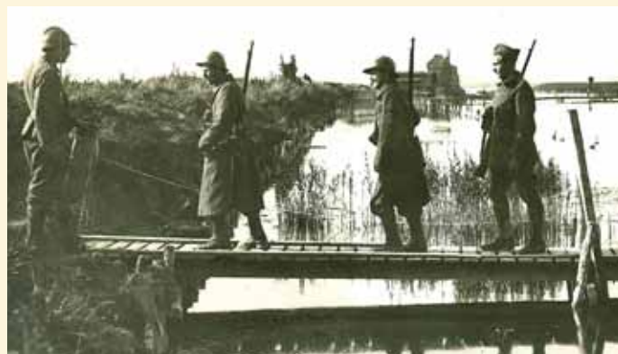
Une passerelle en bois sur la plaine de l'Yser inondée.

Toutefois, le soldat belge sur le front de l'Yser avait également la vie dure, car son équipement, sa nourriture et les aménagements dont il disposait étaient bien plus déplorables que ceux des alliés. Sa solde n'était qu'une fraction de ce que recevait un soldat britannique. S'il est donc vrai que le front de l'Yser ne connut pas de grandes offensives, le soldat belge y était, quatre ans durant, soumis aux bombardements et en proie à toutes sortes de maladies. Les germes de celles-ci proliféraient dans l'eau croupissante et polluée. Vers 1917, le moral du soldat belge était au plus bas, ce qui entraînait bon nombre de problèmes disciplinaires. En effet, il manquait aux Belges