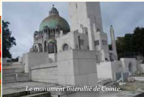
Le monument interallié de Cointe.

Informations complémentaires : www.be14-18.be