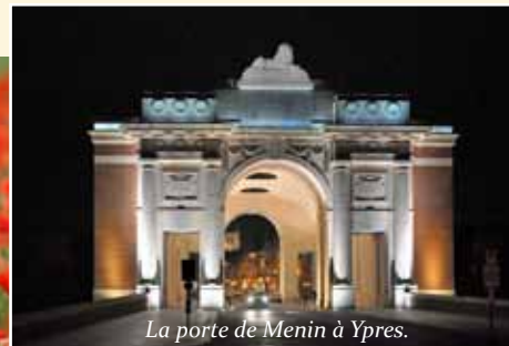
La porte de Menin à Ypres.