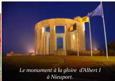
Le monument à la gloire d'Albert I à Nieuport.